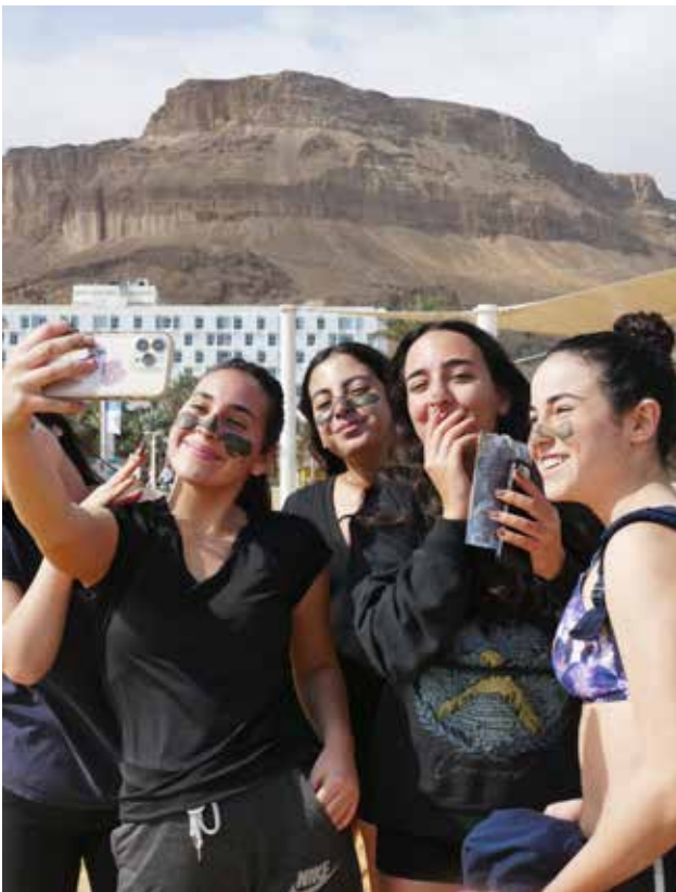
Schlammige Gesichtsmasken am Toten Meer

Am Freitag haben wir mit unseren Austauschpartnern Haifa erkundet, und am Abend wurde das Kiddusch gefeiert, ein gemeinsames Abendessen mit allen wunderbaren Spezialitäten der Levante zum Beginn des Schabbats. Dieser wurde dann in den Familien verbracht, zum Beispiel mit einem Tagestrip in die Kreuzfahrerstadt Akko oder einem Besuch des Fußballspiels von Hapoell Haifa. Das Spiel war zwar auf Kreisliganiveau, aber die Stimmung war mega.