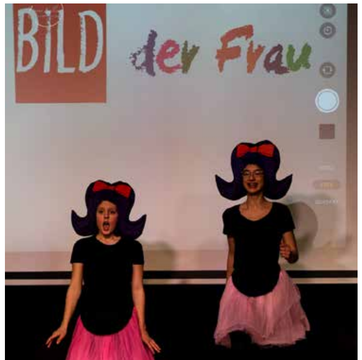
„Seitdem ich aber einen Dyson besitze, trage ich meine Haare ab und zu auch mal offen.“