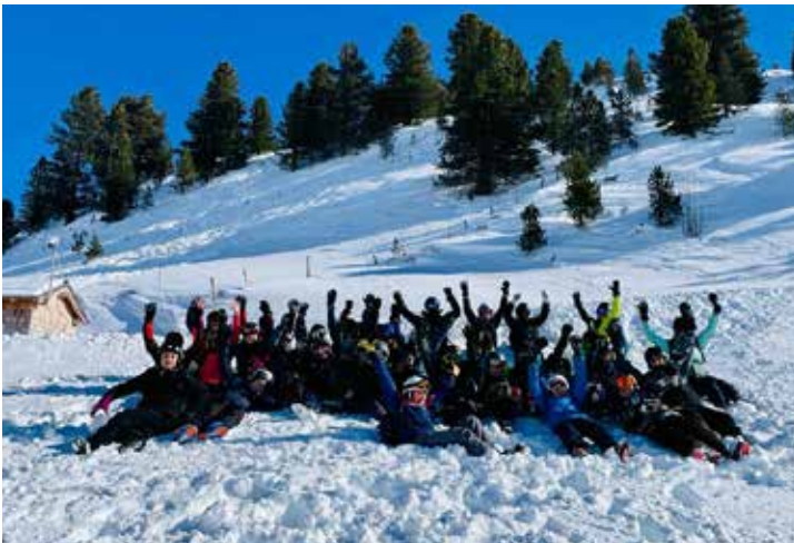
7b im Schnee