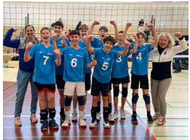
OSG – Volleyballer WK III

Die Mädchen erreichten das Regionalfinale und belegten dort einen vierten (WK III) und fünften Platz (WK II). Im Wettkampf IV erreichten die Mädchen und Jungen jeweils den zweiten Platz im Regionalfinale, das Landesfinale steht noch aus. Am erfolgreichsten waren die Jungs, die sowohl im Wettkampf II wie im Wettkampf III das Landesfinale erreichten, das in unserer eigenen Sporthalle vor einer tollen Kulisse mit zahlreichen Fans ausgetragen wurde.