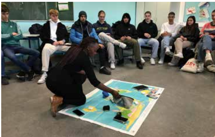
Workshop im OSG