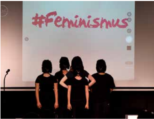
„Würde ich mich als Feministin bezeichnen?“