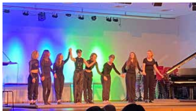
Kulturabend des Jahrgang 12

Am 20. Januar 2023 veranstaltete der Abiturjahrgang seinen Kulturabend. Mit der tatkräftigen Unterstützung vieler Helfer*innen konnte ein interessantes Programm, eine breite Auswahl an Essen und Trinken und eine schöne Atmosphäre geschaffen werden.