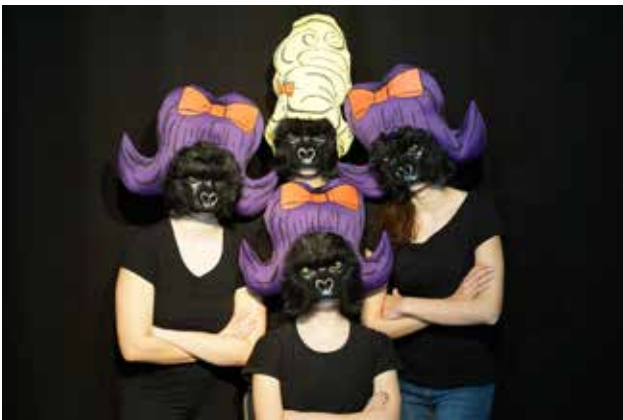
„Wenn nicht wir, wer? Wenn nicht jetzt, wann? Wenn nicht jetzt, wann? Wenn nicht wir, wer dann?“

Im Rahmen der feministischen Szenencollage „Wer, wenn nicht wir?“ setzten sich fünf junge Frauen mit politischen, gesellschaftlichen und biografischen Aspekten der Themen Feminismus, Sexismus und Gender(un)gerechtigkeit auseinander.