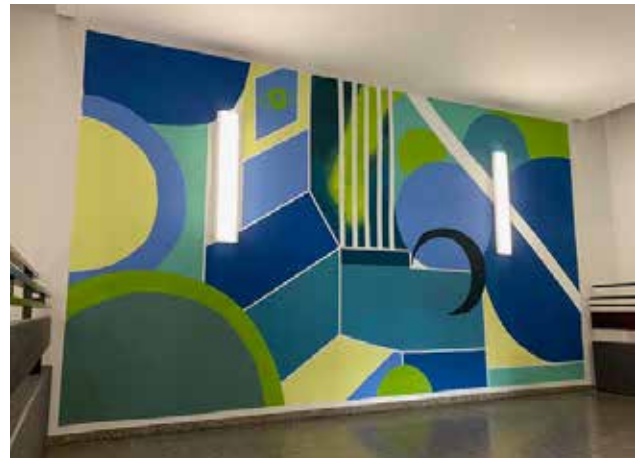
Das fertige Wandbild im Treppenhaus

„Meine Intention war es, das Wesen der Schule, mit all dem Trubel und den vielen Menschenmengen, den vielen überlappenden Gesprächen, dem Lachen und manchmal auch dem reinen Chaos auf den Fluren darzustellen.“