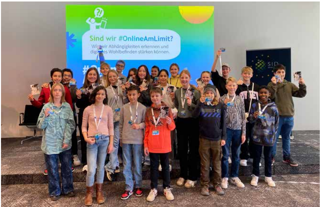
Ein gelungener Safer Internet Day für die Klasse 7a

Verhalten im Internet unter anderem vor laufender Kamera diskutiert wurden. Im Anschluss gab es ein vom Veranstalter gestelltes Frühstücksbuffet. Zudem waren mehrere Reporter/innen und Vertreter/innen bestimmter Radio-, Fernsehsender und Fernsehsendungen anwesend wie zum Beispiel „Logo“ oder „17:30“ auf Sat 1. Wir hatten die Möglichkeit, Interviews und Auskünfte zu der Veranstaltung in verschiedenen Themenbereichen zu geben, die teilweise auch gesendet wurden.