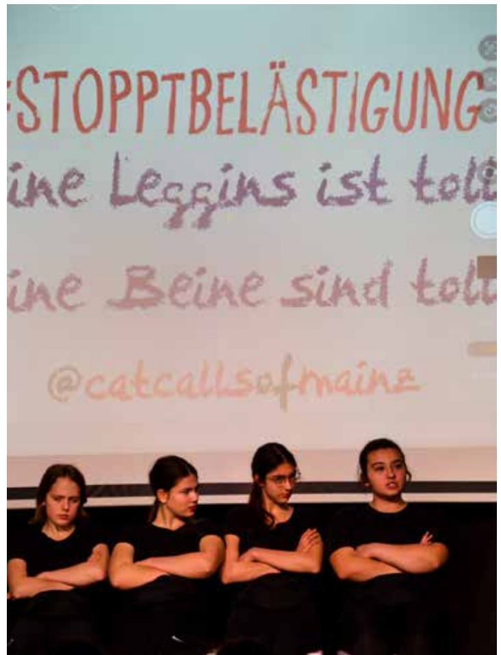
„80% aller Frauen wurden schon einmal in der Öffentlichkeit belästigt.“

Inwiefern Gleichberechtigung auch ein Problem von Männern sei und welche Dinge die Mädels ausprobieren würden, wenn sie für einen Tag ein Mann wären, wurde ebenfalls dargestellt.