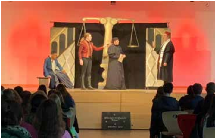
White Horse Theatre

auch danach noch Raum für ein spontanes Meet 'n Greet, bei dem einige Schüler ihr Englisch in der Praxis ausprobieren konnten.