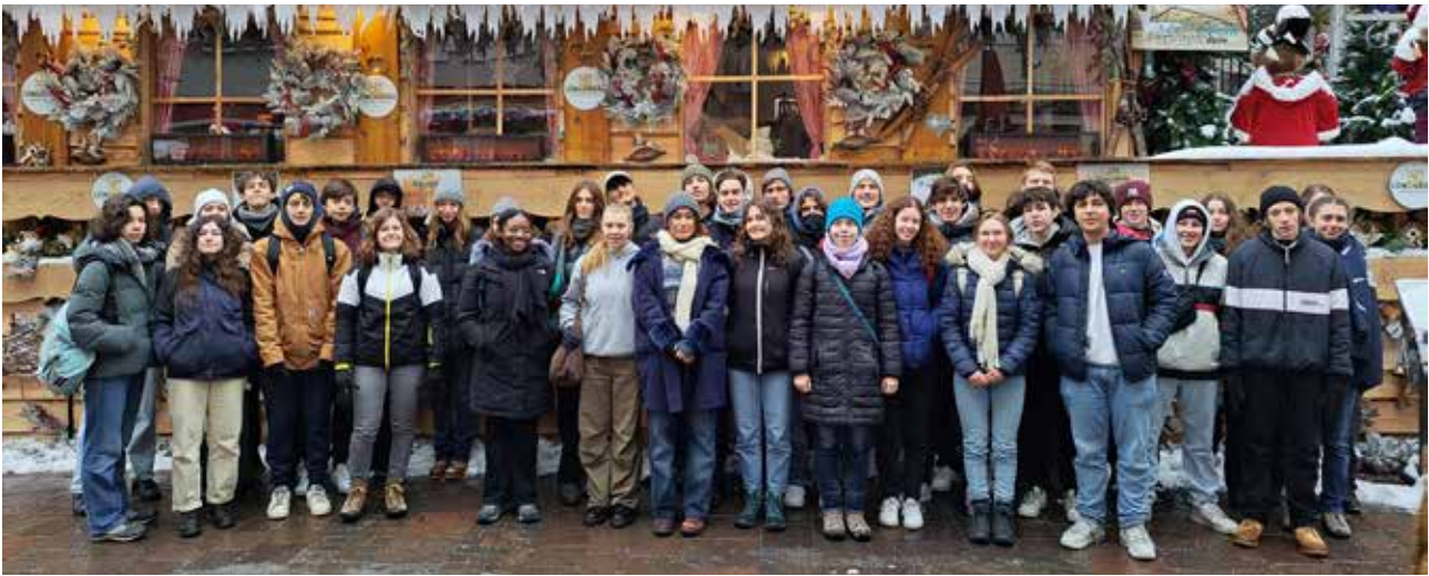
Deutsch-französische Schülergruppe in Niederbronn (Elsaß)

führung in die sogenannte Gedenkarbeit. Die Workshops fanden am gleichen Ort statt, an dem wir auch untergebracht waren, nämlich der Internationalen Begegnungsstätte Albert Schweitzer (CIAS). Diese liegt direkt an einem deutschen Soldatenfriedhof des Zweiten Weltkriegs, durch den wir auch noch am selben Tag geführt wurden.