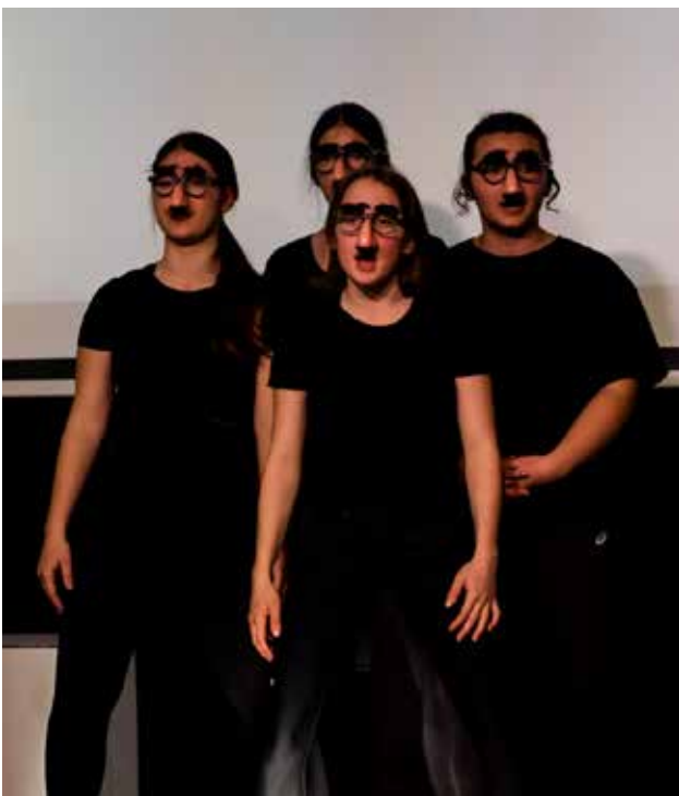
„Der Feminismus wurde ins Leben gerufen, um unattraktiven Frauen einen leichteren Zugang zum Mainstream zu ermöglichen.“