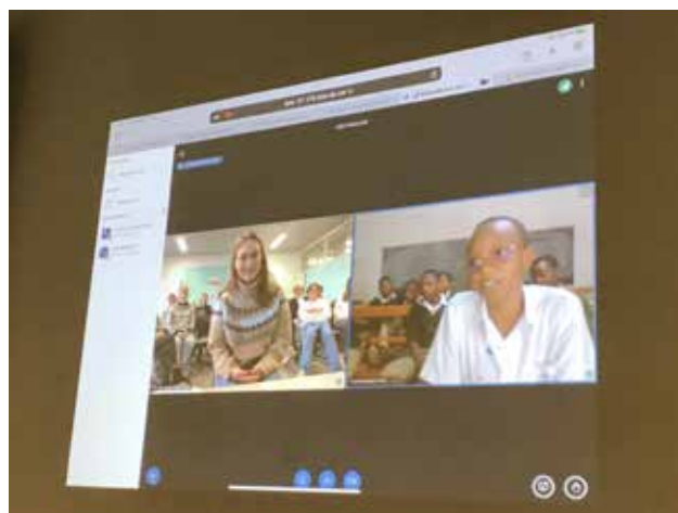
Videokonferenz mit der Partnerschule in Kigali, Ruanda