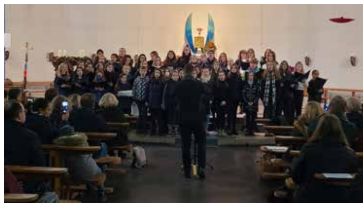
Beide Chöre beim gemeinsamen Abschlusstück

Der Mittelstufenchor übernahm im Anschluss mit den beschwingten Stücken „This Little Light of Mine“ und „Take a Winter Walk With Me“. Abgerundet wurde ihr Auftritt von den beiden ruhigeren Werken „Thy World“ und „May the Lord Send Angels“. Mit „Swing into Christmas“ (Arr.: F. Bernaerts) zeigte die ConcertBand nochmals Ihr Können, ehe alle drei Ensembles das Adventskonzert mit dem gemeinsam vorgetragenen Stück „Still, Still, Still“ (Arr.: E. Hucyby) unter großem Applaus für alle Beteiligten beendeten. Während des Konzerts wurde das Publikum mit „Lasst uns froh und munter sein“ sowie „Tochter Zion“ zum Mitsingen motiviert.