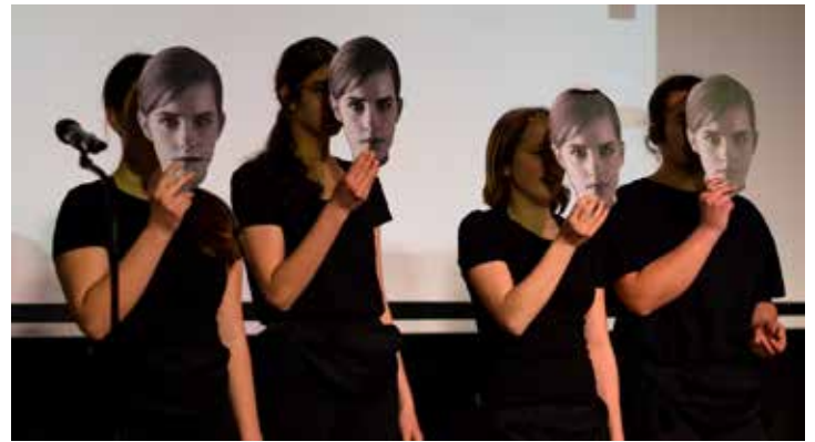
„Irgendwie verbinde ich mit Feminismus Emma Watson. Sie ist eine sehr starke Frau, die sich mit der Größe ihrer Bekanntheit besonders für die Rechte von Frauen ausspricht und dafür kämpft.“