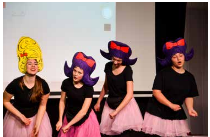
„Kochen, putzen und gut aussehen, das mache ich als Frau am liebsten!“

Die eigenen Erfahrungen mit sexueller Belästigung im öffentlichen Raum wurden szenisch verarbeitet, aber auch wie man in solchen Situationen selbst oder als Zeug*in handeln kann.