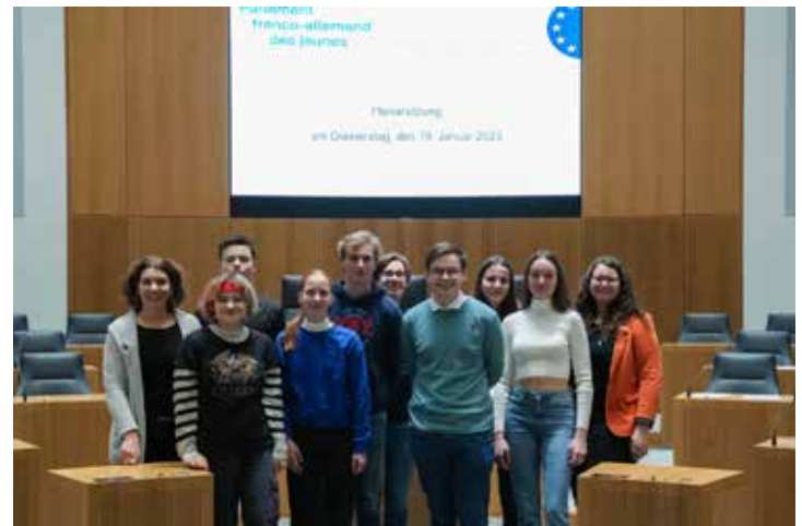
11er Französisch-Bili-LK im Landtag