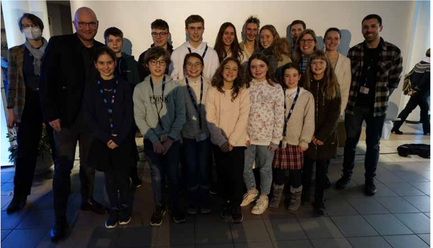
Jufo- / Schüex-Wettbewerb Mainz