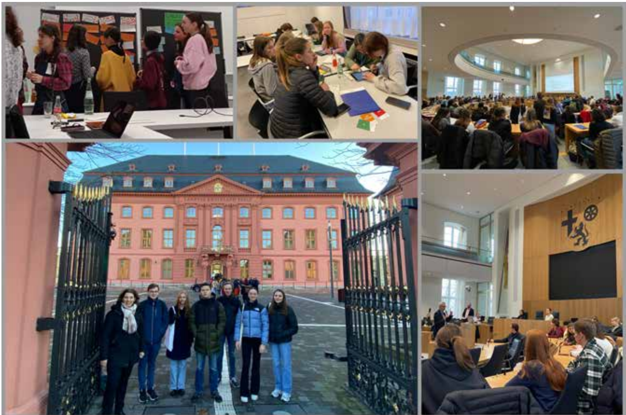
Collage zum deutsch-französischen Schüler-Landtag

Nach einem anstrengenden Tag haben wir in Kleingruppen die Stadt erkundet, denn am nächsten Tag ging es bereits