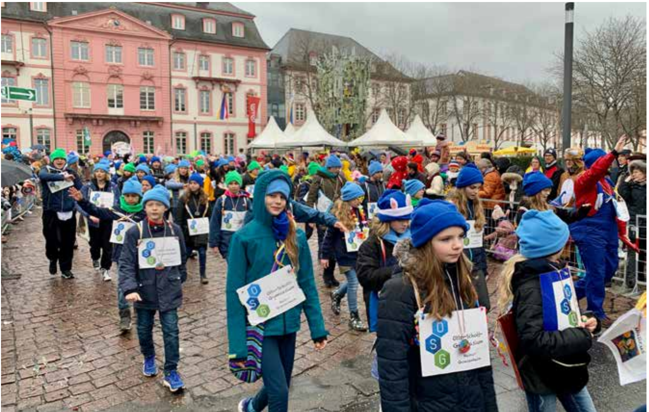
OSG-Mainzelmännchen auf dem Jugendmaskenzug

mützen in den drei typischen OSG-Farben für alle Teilnehmenden zu nähen. An dieser Stelle möchten wir den Näherinnen noch einmal herzlich danken!