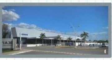
El día después volaría a la capital Mérida.