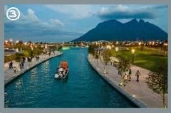
Por la tarde saldría a pasear por el "Paseo de Santa Lucía".