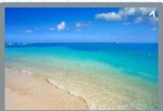
Por la mañana iría a la playa linda y nadaría.