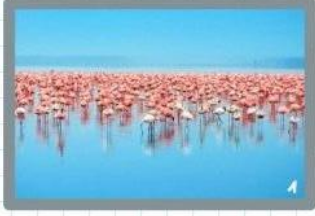
Al día siguiente haría un paseo en barco en Celestún y vería los flamencos.