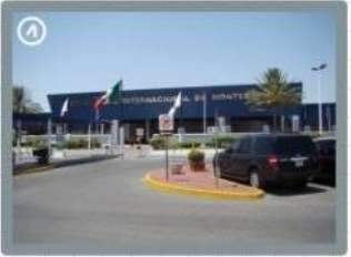
Al día siguiente volaría al aeropuerto de Monterrey.