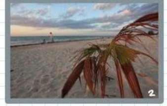
Después de eso, visitaría la playa.