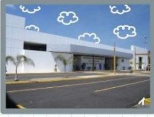
Por la mañana aterrizaría en Xalapa.