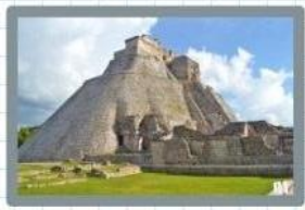
Por último, iría a las ruinas de los mayas, llamadas Uxmal.