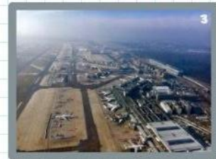
Por último, volvería al aeropuerto de Frankfurt y iría a casa.