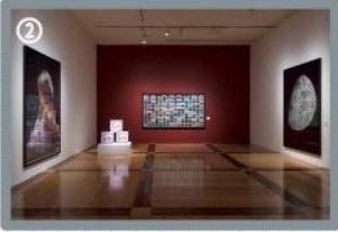
Después visitaría el Museo de Arte Contemporáneo.