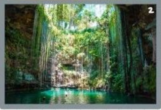
Un poco más tarde haría una excursión de un día al "Cenote Ik Kil" y nadaría también.