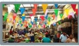
Entonces visitaría el Mercado "Lucas de Gálvez".