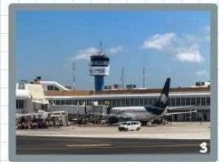
Finalmente, volaría al aeropuerto de Cancún.