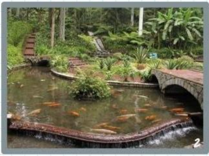
Por la tarde pasearía por las calles del Callejón del Diamante.