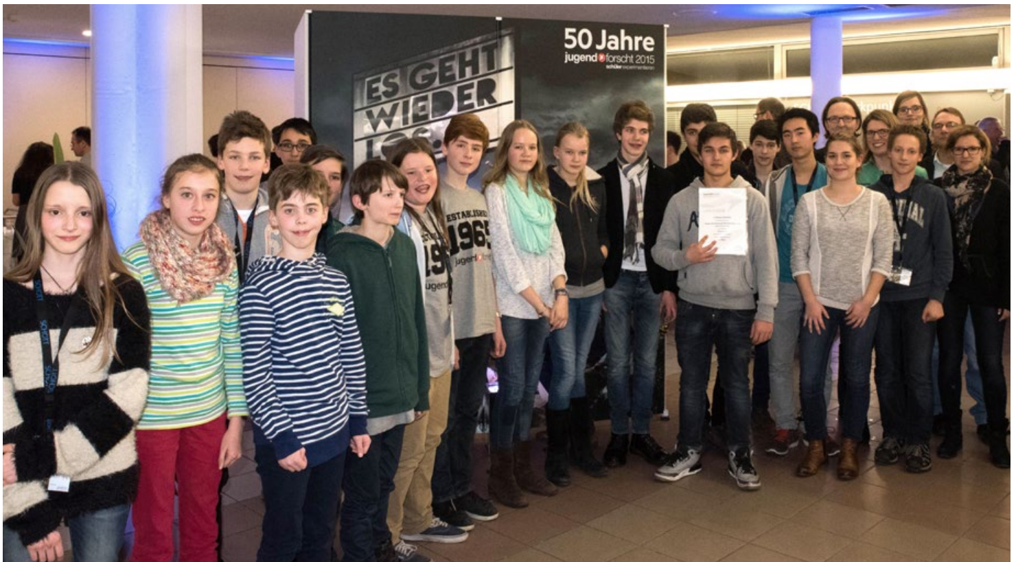
Die stolzen PreisträgerInnen freuen sich

*„Schüler experimentieren“ ist die Jugendsparte von „Jugend forscht“ für Teilnehmer bis 14 Jahre