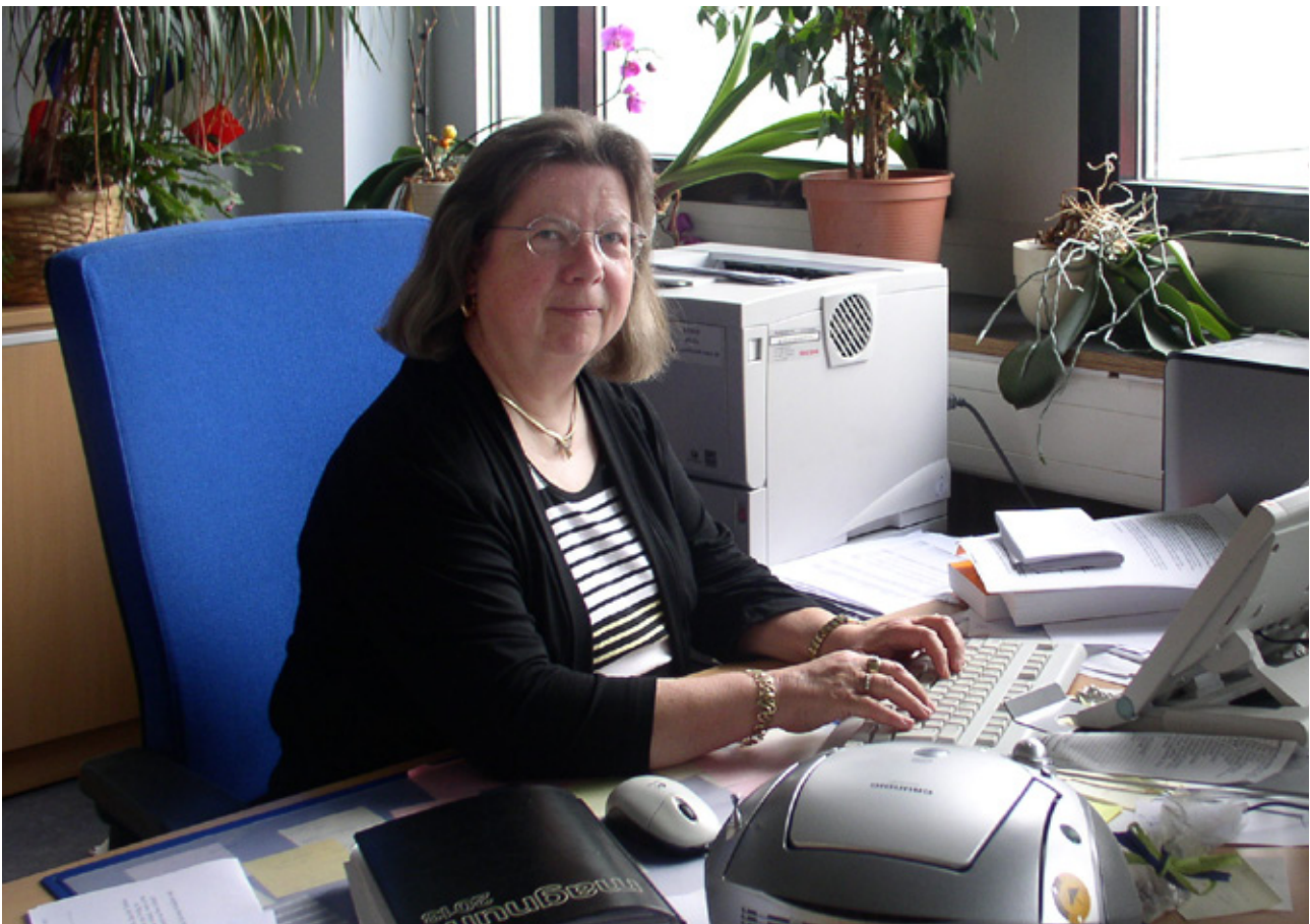
Am Arbeitsplatz 2013

Mehr Zeit für Mann, Hund, Freunde und Familie; „Ausmisten“; Liegengebliebenes in Haus und Garten aufarbeiten; viel Zeit zum Lesen; wieder anfangen, Klavier zu spielen; mehr Zeit für Reisen (u.a. Wohnwagen reaktivieren); Motorrad(bei)fahren; Ahnenforschung betreiben; Sprachkurs machen