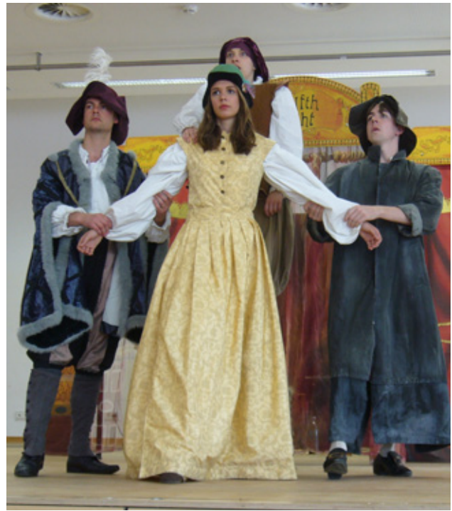
Szene aus „Twelfth Night“