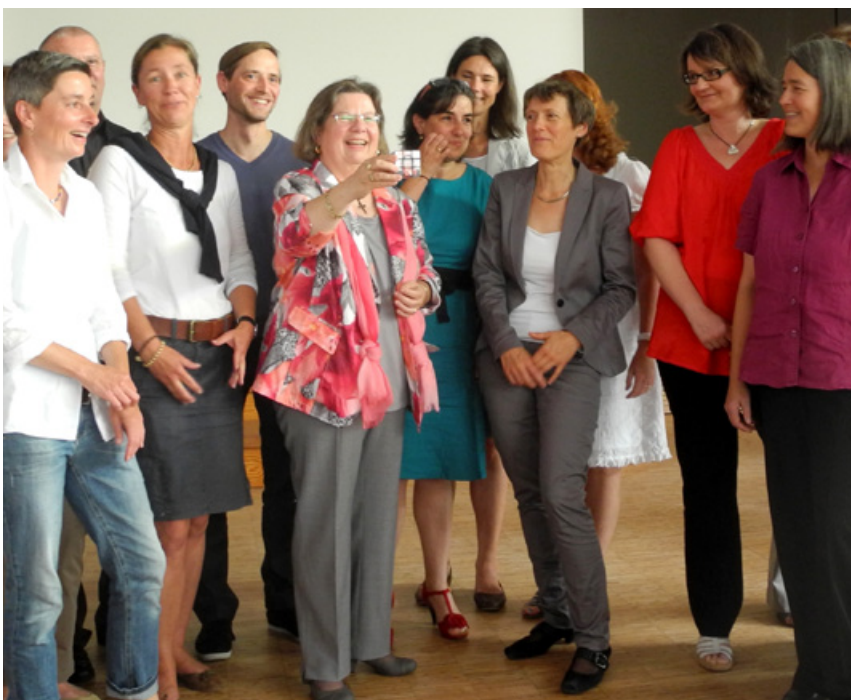
Mit dem Zauberwürfel, dem Geschenk des Schulleiternbeirats „für lange Winterabende“