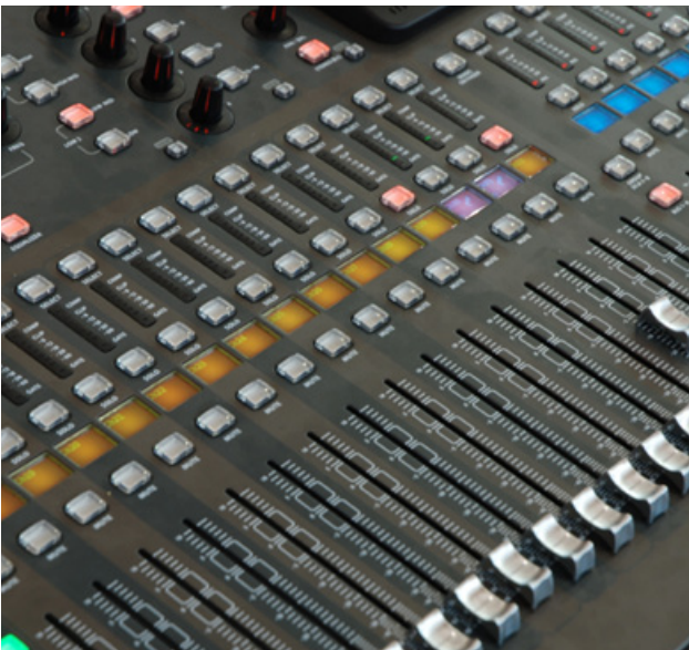
Viele Regler, toller Klang – die neue Tonanlage des OSG